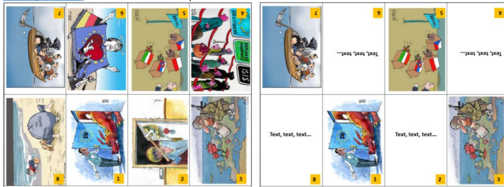
Verzia iba s obrázkami

Z obrázkov, karikatúr žiaci vyrobia skladačku – knižku (návod: https://www.youtube.com/watch?v=WzS3jPO7BA ) a k obrázkom doplnia text.