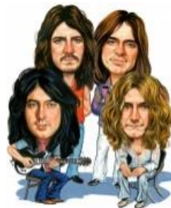
(Led Zeppelin 3 )