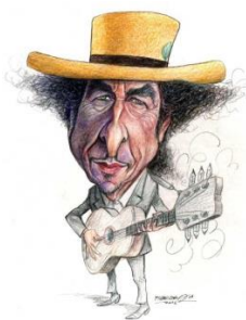
(Bob Dylan 1 )